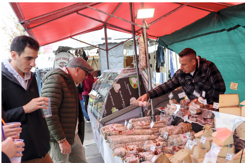
Delikatessen aus Italien.