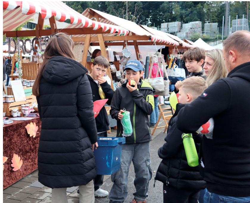
Gross war das Interesse an den einzelnen Marktständen bei Kindern und Erwachsenen.

Kunsth Handwerk und Spielsachen präsentierten die Standbetreiber. Um sich einen Überblick zu verschaffen, bot sich eine Rundfahrt im Märtbähnli der Jubla Gachnang an. Es gab Zeit für Gespräche und für die Stärkung war in den Festbeizli gesorgt. Die Fischknusperli waren beliebt. Zur Abwechslung gab es an Essensständen Burger vom Grill, Thai food, Crêpes oder PopCorn, um nur einige zu nennen. Musikalisch wurden verschiedene Plätze bespielt. Wie im vergangenen Jahr standen die Trikes zu einer Ausfahrt bereit und das alles für einen guten Zweck. Der «Härbscht Märt» war ein gelungener Anlass. (mo)