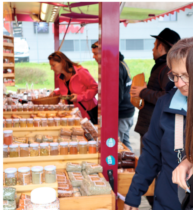
Gewürze aus aller Welt.