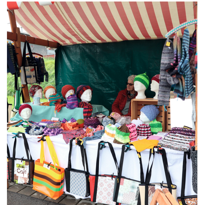
Strickwaren für die kalte Jahreszeit.